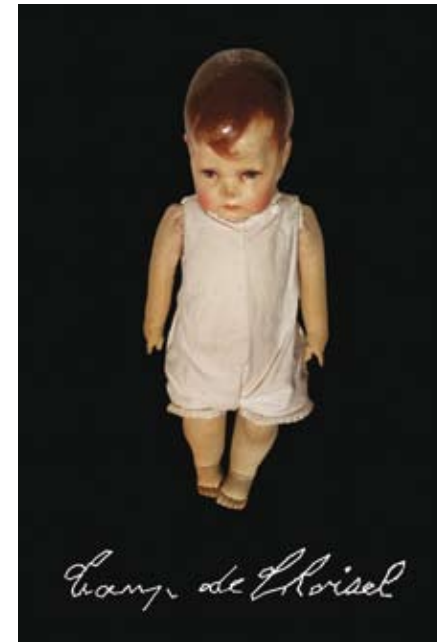
Camp de L'oiseil