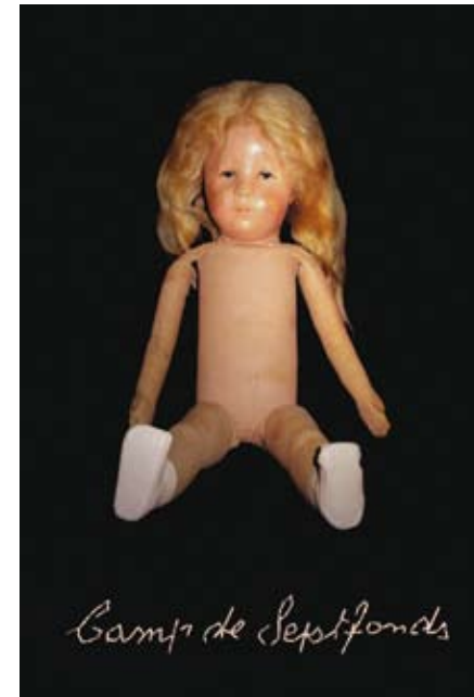
Camp de Septfonds