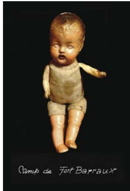
Camp de Fort Barraux