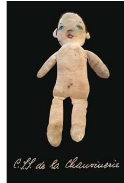
C.L.P. de la Chauvinière