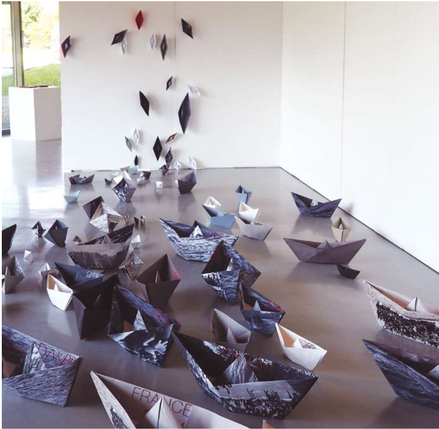
Bateaux sur l'eau, papier plié et broderie 2017