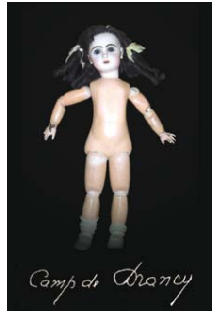
Camp de Drancy