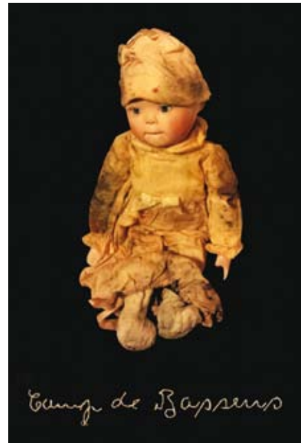
Camp de Bassens