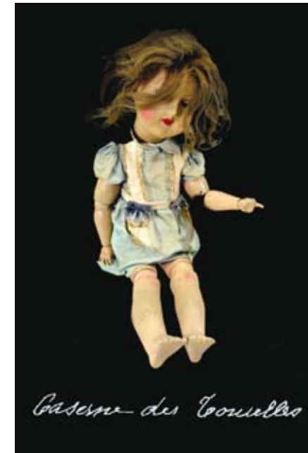
Caserne des Couelles