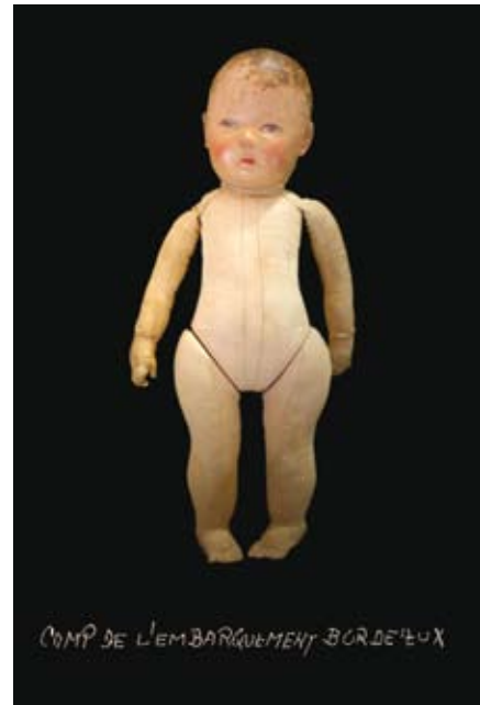
CAMP DE L'EMBARQUEMENT BORDEAUX