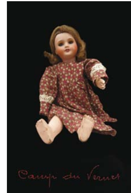
Camp du Vernet