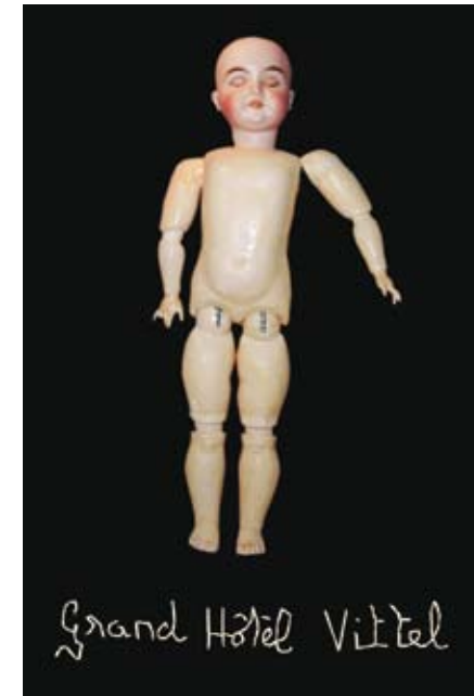
Grand Hôtel Vitel