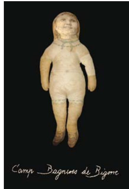
Camp Bagnères de Bigorre