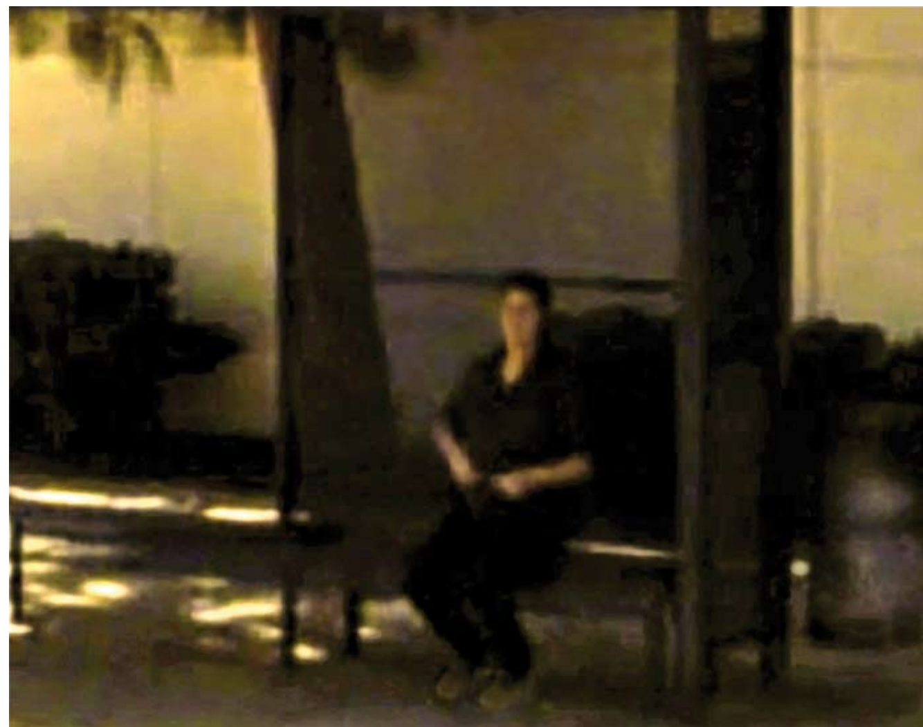
1538, market st, San Diego N.Y.