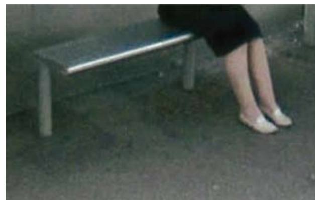
Bd Mal Leclerc, Grenoble