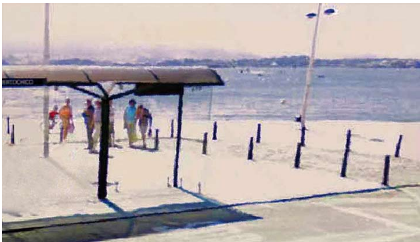
Santander, adresse inconnue