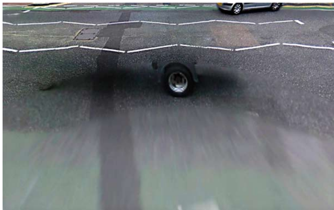
Lancelot st, Londres

Instantanés photographiques, arrêtés sur image, jeux aux limites des techniques numériques, depuis ses débuts dans les années 90 à Ruse, sur les rives bulgares du Danube, Sevdalina Preslava interroge la présence, le temps et l'espace dans l'image. Au début des années 2000, elle sillonne l'Europe et fréquente longuement divers lieux alternatifs. Ce voyage la conduit à Grenoble où elle découvre de nouveaux horizons au contact de chercheurs en informatique. Depuis, elle partage son temps entre Plovdiv et la vallée du Grésivaudan.