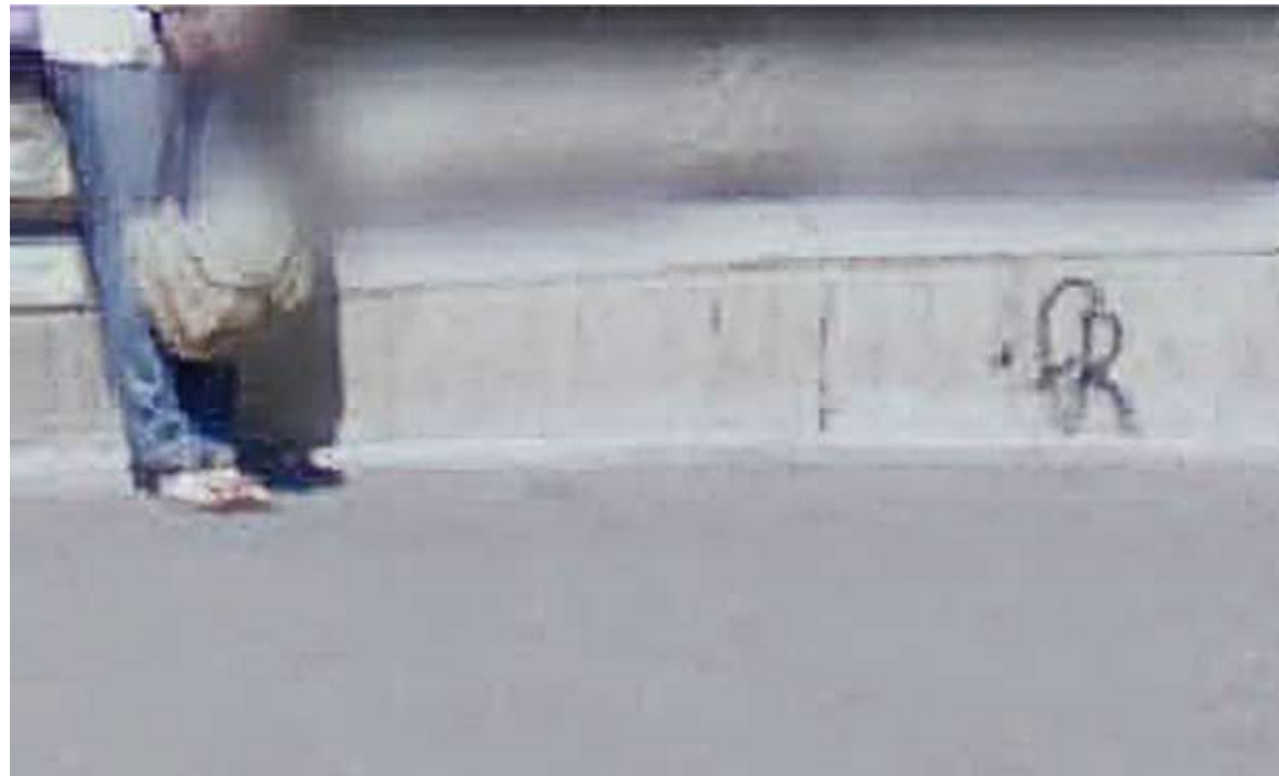
15, cours Victor Hugo, St Etienne