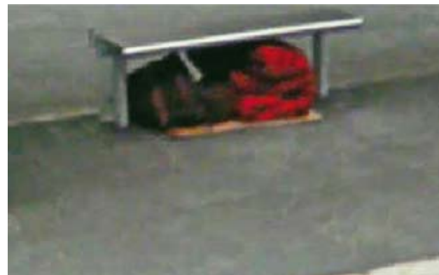
16, Bd Gambetta, Grenoble