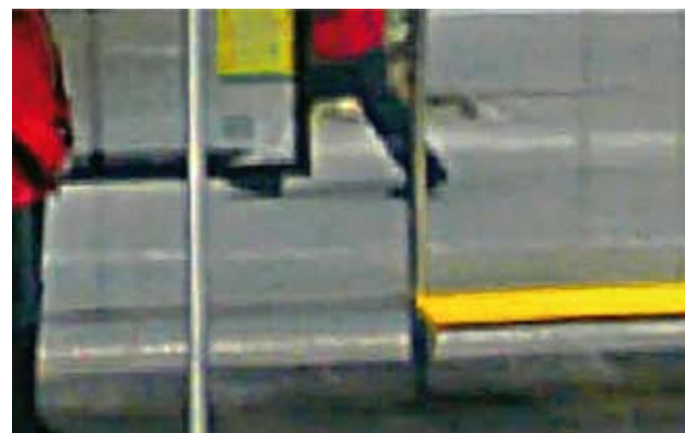
3, Avinguda Diagonal, Barcelone